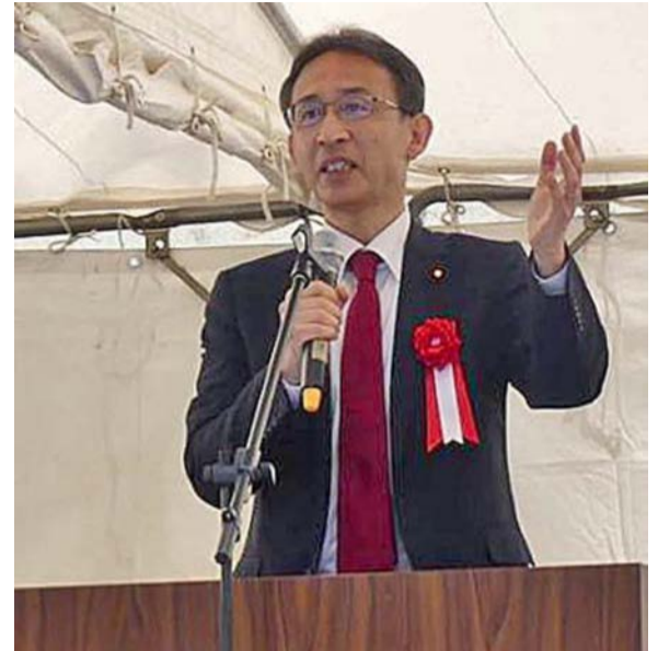
埼玉中央メーデーであいさつする塩川鉄也衆院議員＝5月1日、さいたま市内