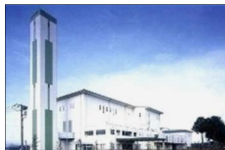
霞台厚生施設組合の旧ごみ処理施設

霞台厚生施設組合の負担金について、霞台ごみ処理施設の解体費用を計上しないのは当然であり、評価されます。【3面参照】