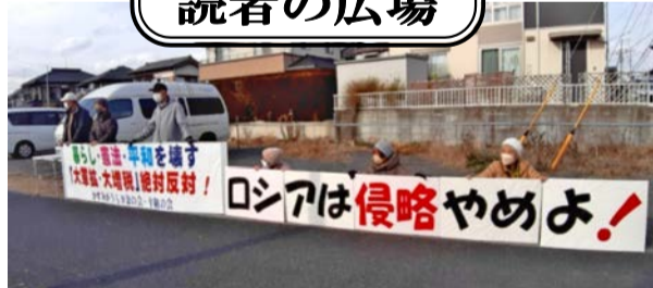
2023年2月19日ロシア侵略1年のスタンディング

のほか東日本大震災の復興財源である復興特別所得税の半分近くや、さらには国会でも議論されて知りましたが、「医療・年金の財源」も活用することが計画に入っています。こんなことが、実行されたら国民の生活は戦前のように「欲しがりません。勝つまでは」になつてしまうのではないのでしょうか。